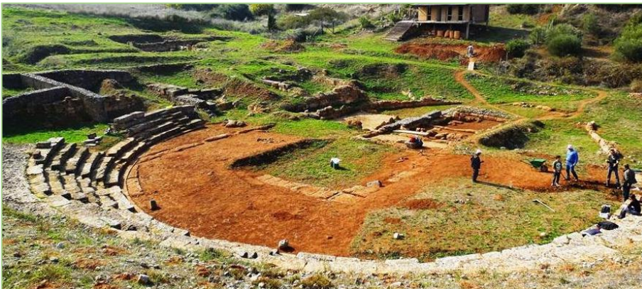
Φωτογραφία από το Καβίριο, 2014