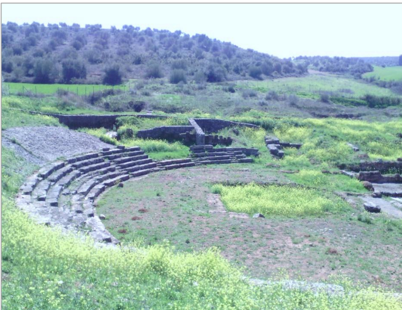
Φωτογραφία από το Καβίριο, Μάρτιος 2017