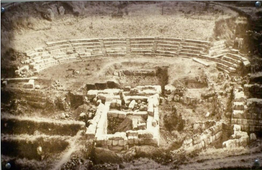
Φωτογραφία από τις ανασκαφές στο Καβίριο

Συγκρίνετε τις παρακάτω φωτογραφίες από το Καβίριο. Τι παρατηρείτε; Σε ποιες σκέψεις σας οδηγούν; Καταγράψτε τις και θα τις συζητήσουμε με την επιστροφή μας στο σχολείο.